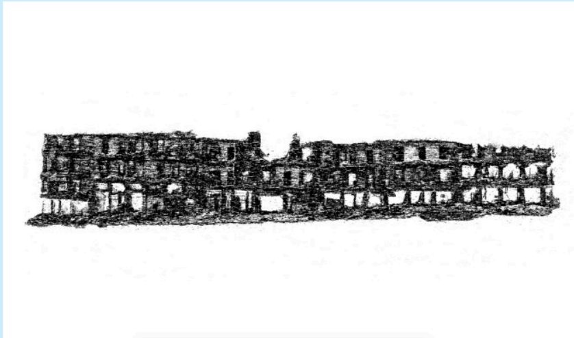
Sawsan Al Bahar, Untitled (Facade), 2023, stampa di grafite su cotone

L’esposizione sarà inaugurata sabato 20 maggio, alle ore 18.00 . Saranno presenti le artiste, che soggiorneranno a Montecchio Emilia, ospiti del Comune, nella settimana precedente il vernissage, per lavorare all’allestimento delle mostre.