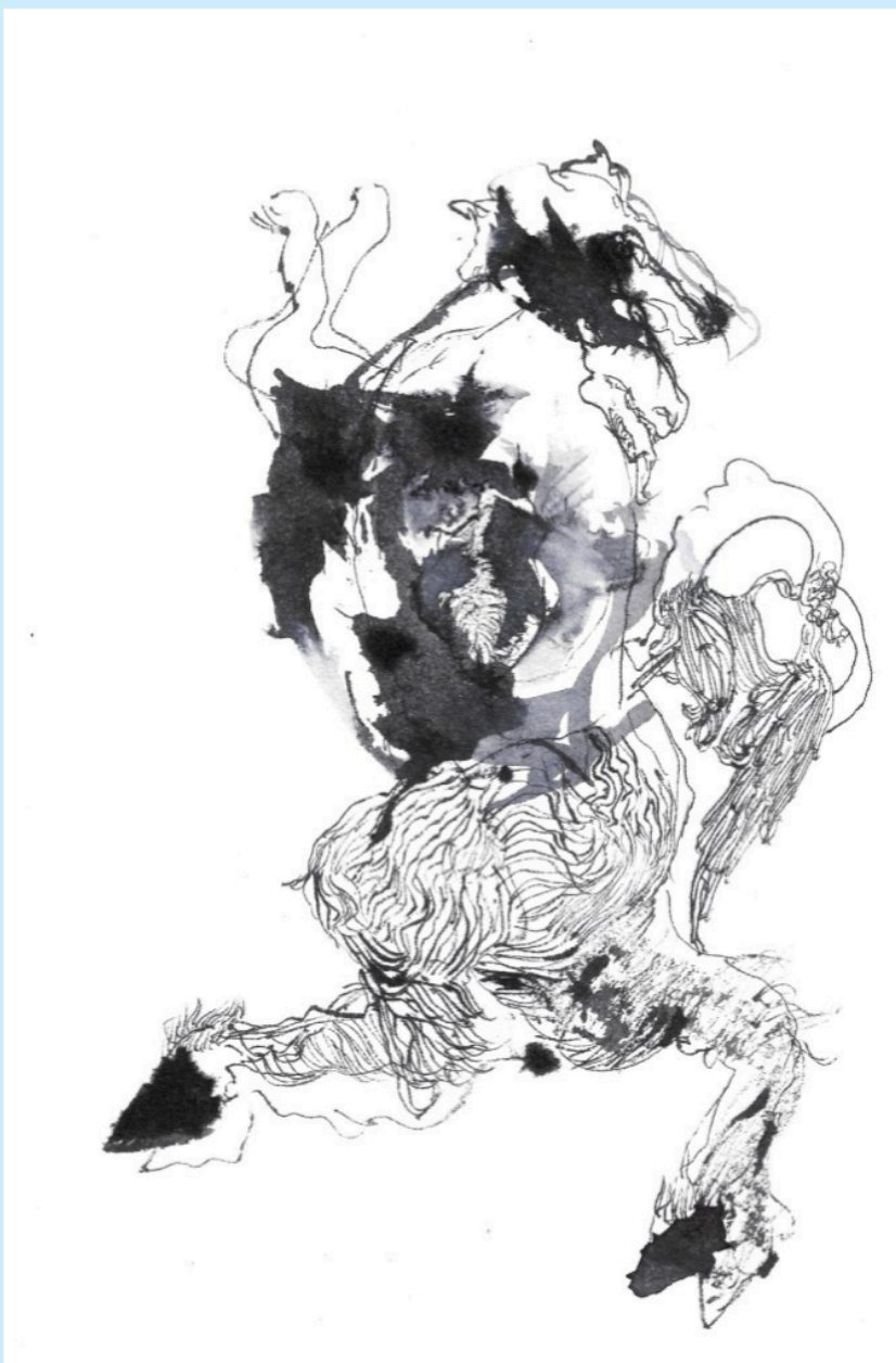
Chiara Calore, Terzo, 2023, china e inchiostro su carta

Il Comune di Montecchio Emilia è partner e sostenitore di questo progetto: ha infatti erogato un premio acquisto del valore di 2.500 Euro e curato l'organizzazione delle mostre personali dedicate alle artiste vincitrici. Una ulteriore acquisizione, del valore di 3.500 Euro, è stata operata dall'Associazione culturale artMacs.